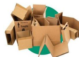
Grands emballages en carton

Les grands cartons posent des problèmes sur les tapis de tri, ils sont donc à déposer en déchèterie. Ils seront directement mis en balles et envoyés vers l'usine de recyclage (cartons de déménagement, de produits high tech ...).